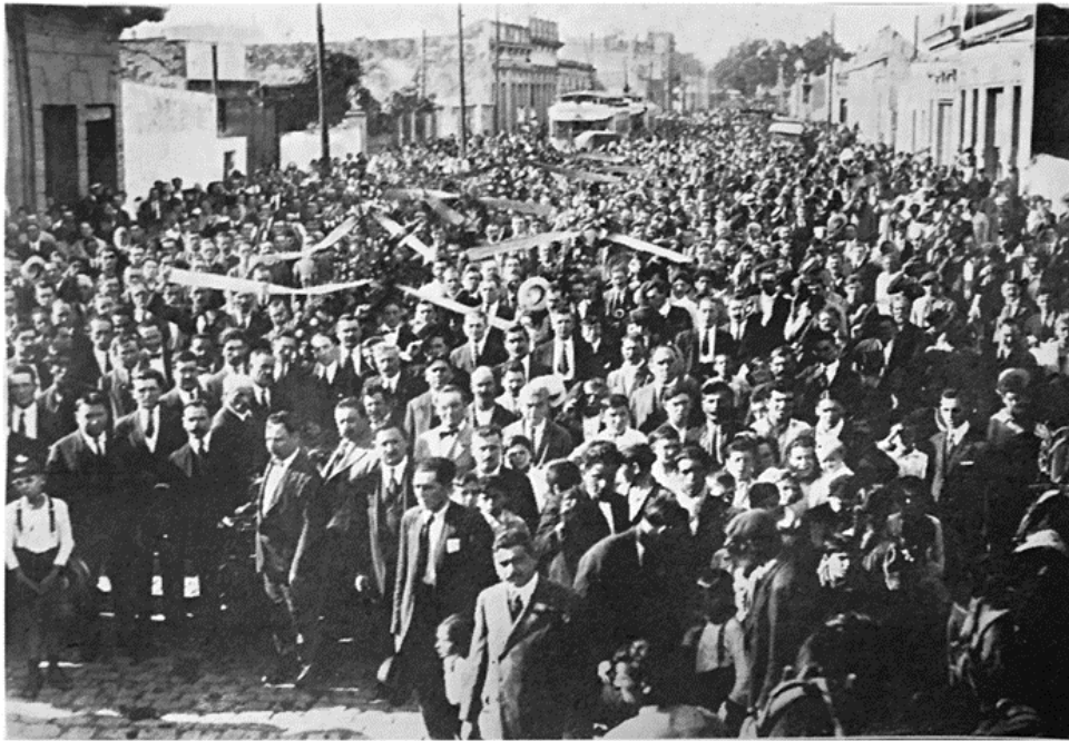
Imagen 2 Vista de la concurrencia en la manifestación de duelo (LF 20/03/1921, p. 9)

a luz tras una intervención quirúrgica, el cadáver fue trasladado a su domicilio en donde continuó el desfile ininterrumpido de personas -más de diez mil calculó LF- que esperaban para ver al “héroe caído”. 46 De hecho, en la tarde del sepelio, el movimiento ferroviario de Rosario quedó interrumpido casi totalmente y, gracias a ello, numerosos trabajadores pudieron acompañar los restos del maquinista. En el cortejo, el ataúd fue llevado a pulso durante once cuadras y rodeado de una enorme concurrencia hasta llegar al coche fúnebre.