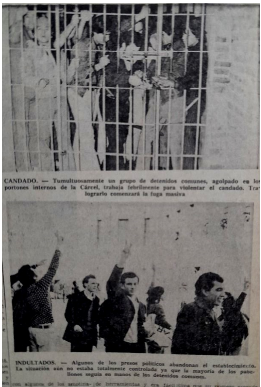
Imagen 5. Detenidos comunes y detenidos políticos