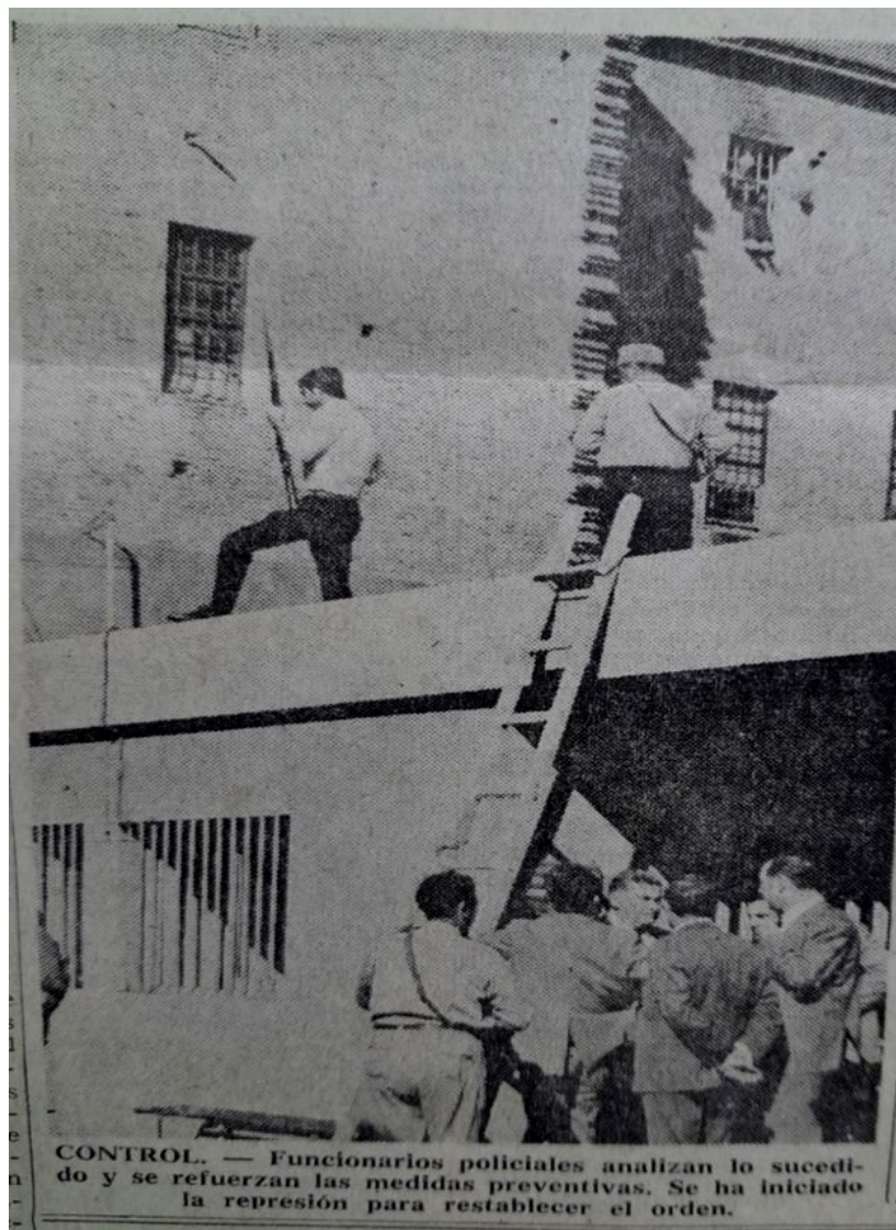
Imagen 7. La policía recupera el control en Encausados