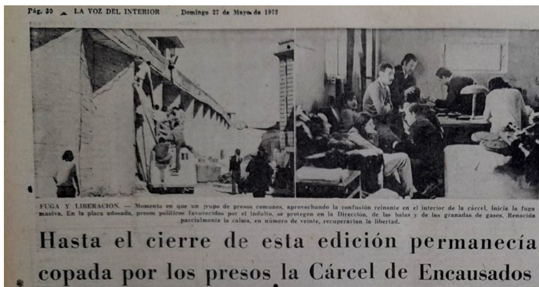
Imagen 4. Copamiento de la cárcel de Encausados