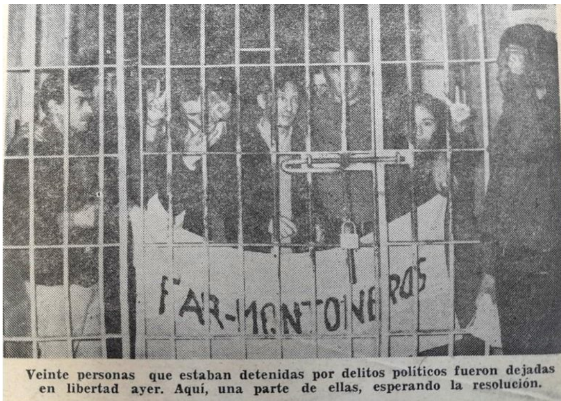
Imagen 1. Presos políticos esperando la liberación