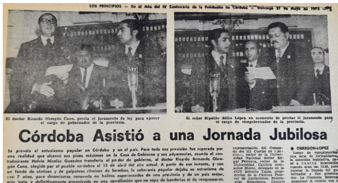
Imagen 3. Córdoba asistió a una jornada jubilosa