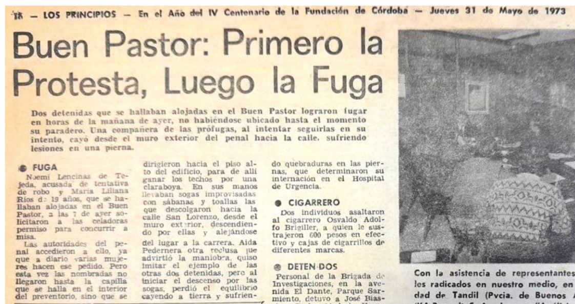
Imagen 12. La prensa analiza los sucesos en el Buen Pastor