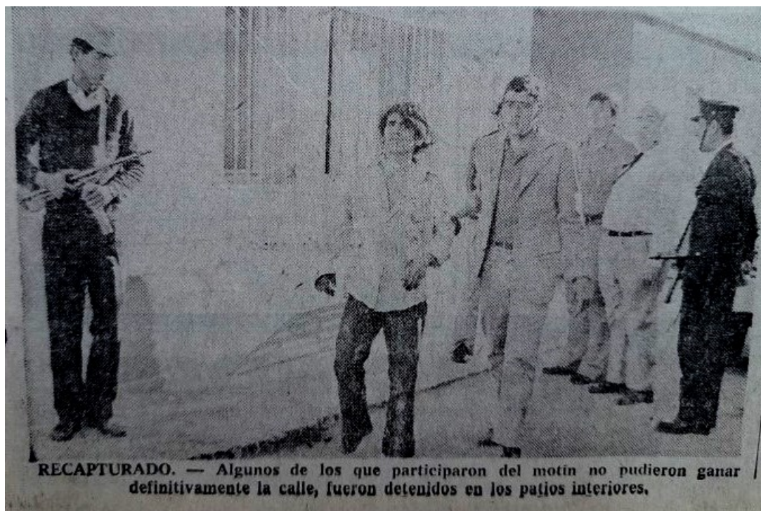
Imagen 6. Recapturan a un penado fugado