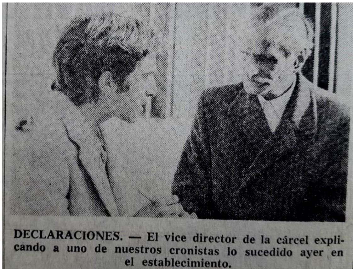
Imagen 9. Autoridades de la cárcel con la prensa