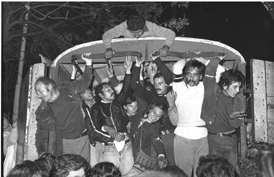
Imagen 2. Liberación de los presos en la cárcel de Villa Devoto

registrada por múltiples fuentes, como las crónicas periodísticas de la época y las de los años siguientes que en general hicieron hincapié en el clima violento que rodeó al acontecimiento.