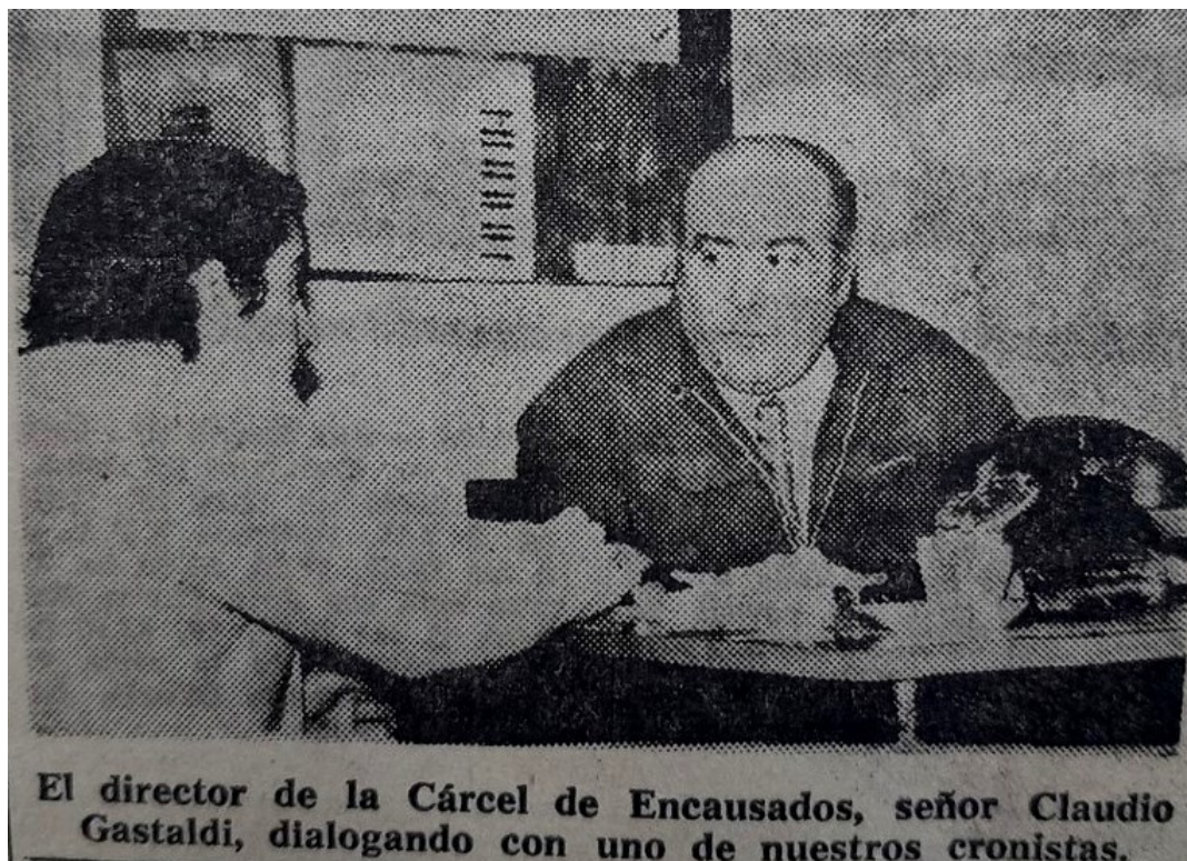
Imagen 10. El director de la cárcel con la prensa