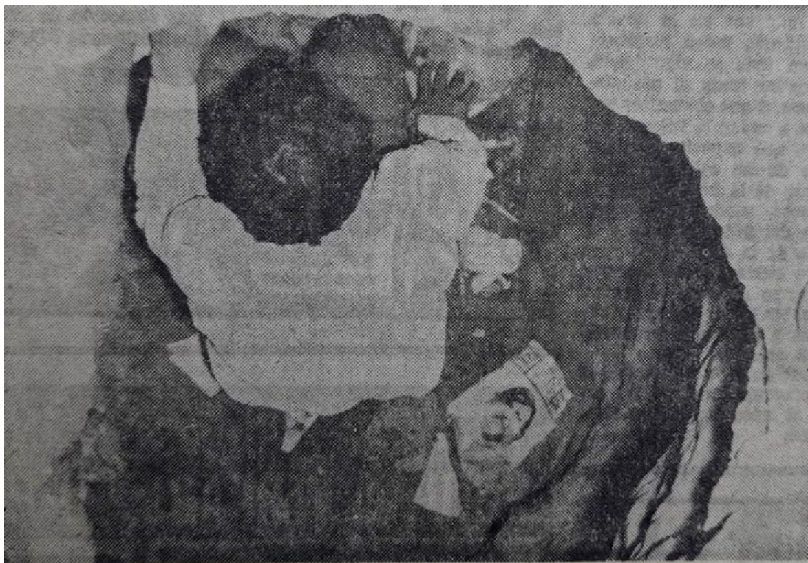
Imagen 8. El túnel realizado para intentar fugarse

La nota gráfica muestra la boca de uno de los túneles que los detenidos realizaron durante el motín. El mayor que partía desde las dependencias de mantenimiento hacia calle Belgrano, tenía alrededor de diecisiete metros de longitud por ochenta centímetros de diámetro.